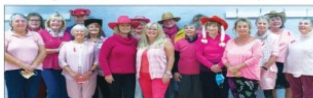
One of ACFAA's line dancing classes gets ready for a 'dancerthon' to support Pink October